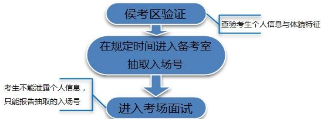
图 3. 面试类专业复试主要流程

面试类专业复试视生源情况尽量实行多考场制, 组织过程严格执行“三随机原则”: 即考官随机分组、考场随机安排、考生随机入场。使考生、考务人员、考官均无法提前预知具体安排。考试过程中考生不能泄露个人信息, 考试过程全程录像。复试流程大致如下图所示: